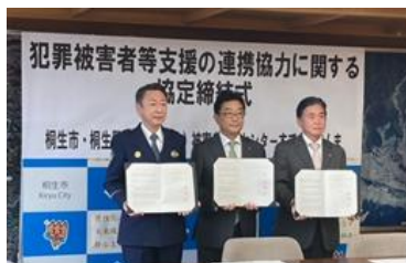
桐生市・桐生署との3者協定