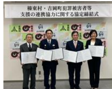
榛東村・吉岡町・渋川署との3者協